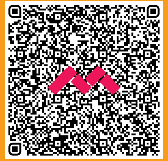
TABELA DE PEÇAS ORIGINAIS JUNHO 2026